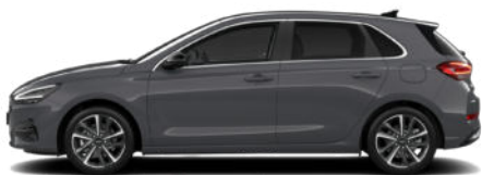
Ecotronic Grey Pearl