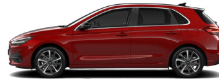
Ultimate Red Metallic