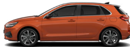
Jupiter Orange Metallic