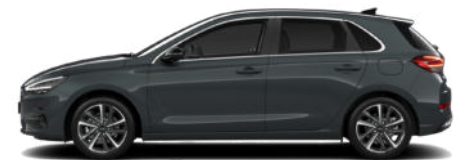
Cypress Green Pearl