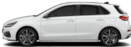
Serenity White Pearl