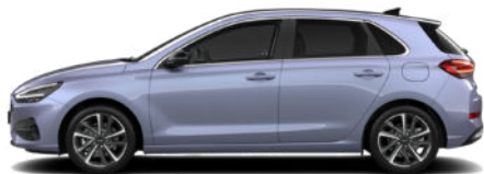
Meta Blue Pearl