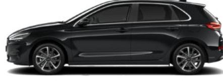
Abyss Black Pearl