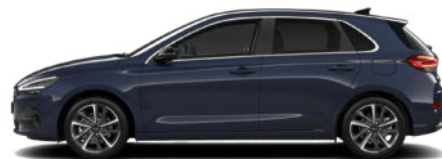
Sailing Blue Pearl