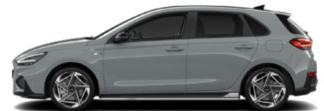
Shadow Grey nur für N Line