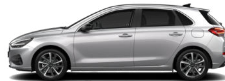
Shimmering Silver Metallic